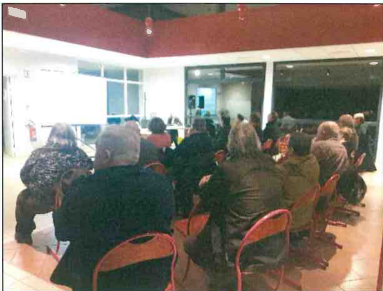
Réunion publique de Chamouille

Pour terminer, à LAON, une dizaine de participants étaient présents, majoritairement représentants des associations « Agir pour le POMA » et « SOS Laon ». Les échanges ont notamment porté sur la sauvegarde du centre-ville et des commerces de Laon ainsi que sur le transport.