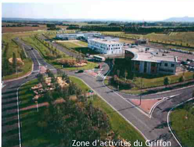
Zone d'activités du Griffon

Cachet et signature du Président de la Communauté d'Agglomération du Pays de Laon