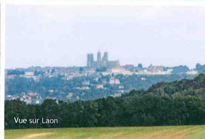
Vue sur Laon