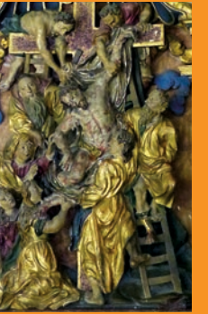
Retable (détail), XVII e siècle