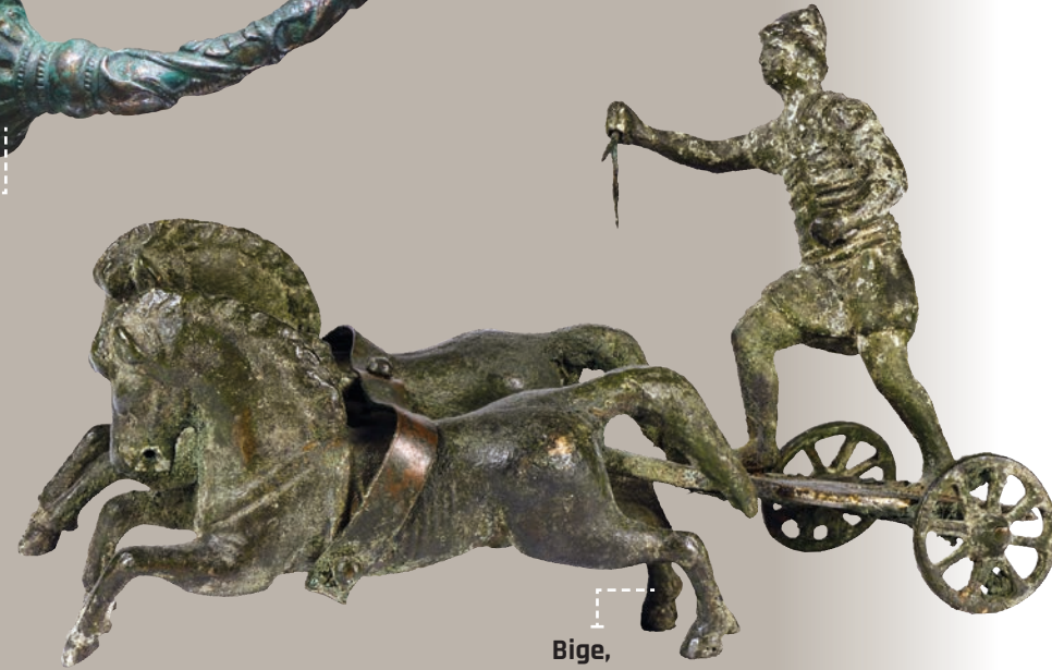
Bigé, époque gallo-romaine