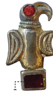
Fibule aviforme, époque mérovingienne