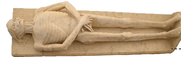
Gisant transi de Guillaume de Harcigny, vers 1394

Reflet de l'important patrimoine monumental de Laon, une salle est consacrée à la période médiévale. De l'époque mérovingienne au XV e siècle, de nombreux objets issus de l'archéologie locale témoignent de la civilisation médiévale: céramiques, bijoux et éléments de parure, monnaies, armes, pierres sculptées et décors d'architecture... Quelques œuvres exceptionnelles sont présentées tels le gisant transi du médecin Guillaume de Harcigny ou un panneau de retable vers 1410.