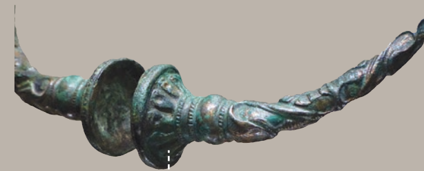
Torque à tampon, époque laténienne

De nombreuses fouilles archéologiques locales ont contribué à l'enrichissement des collections du musée. Des objets de la Préhistoire, de la Protohistoire et de l'époque gallo-romaine évoquent les usages, les conditions de vie, l'art et les croyances de nos lointains ancêtres.