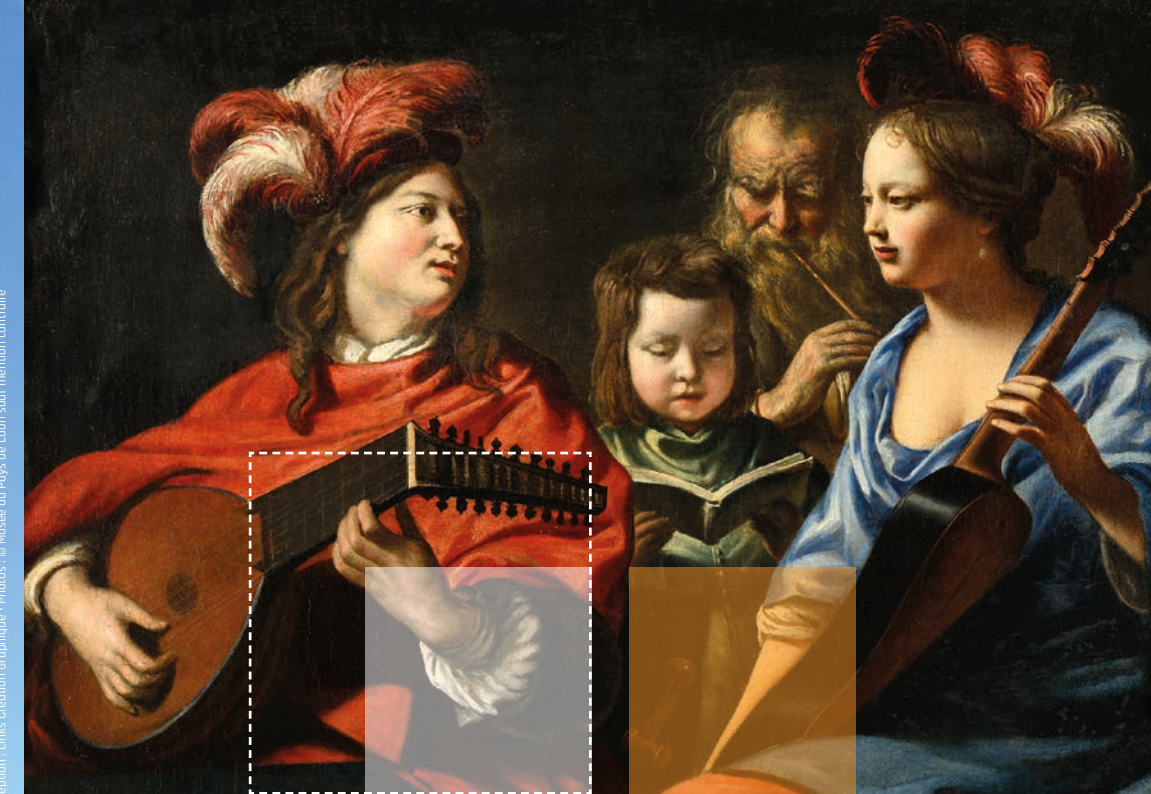
Conception : Links Creation Graphique

ENTRÉE GRATUITE · HORAIRES D'OUVERTURE Du 1 er avril au 31 mai: du mardi au dimanche, de 13h à 17h Du 1 er juin au 31 octobre: du mardi au dimanche, de 10h30 à 17h30 Du 1 er novembre au 31 mars: du mardi au samedi, de 13h à 17h Fermeture les 1 er janvier, 1 er mai, 14 juillet, 24, 25 et 31 décembre Activités pédagogiques et réservations groupes sur demande Musée d'Art et d'Archéologie du Pays de Laon 32, rue Georges Ermant - 02000 LAON tél. 03 23 22 87 00 - musee@ca-paysdelaon.fr - www.ca-paysdelaon.fr