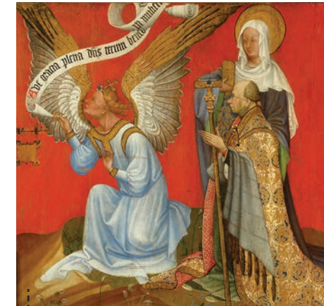
Panneau de retable, vers 1410