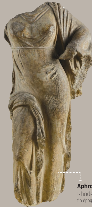
Aphrodite Tiepolo, Rhodes, fin époque hellénistique