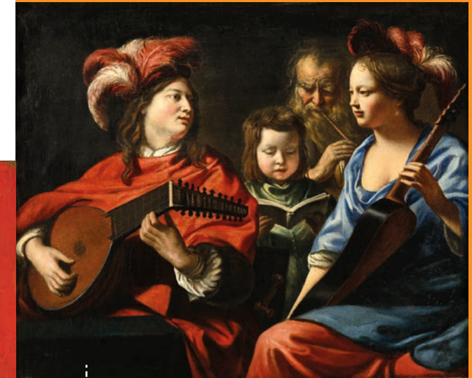
Le Concert, Mathieu Le Nain, vers 1650

Le musée présente une belle collection de Beaux-arts: tableaux illustrant les différents genres en peinture, bustes et sculptures, mobilier, faïences et objets d'art décoratif datant du XV e au XIX e siècle.