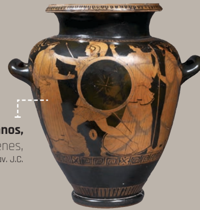
Stamnos, Athènes, vers 440-430 av. J.C.